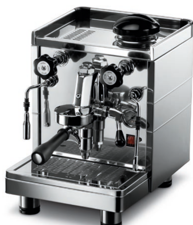
Modello MININOVA CLASSIC versione EMA